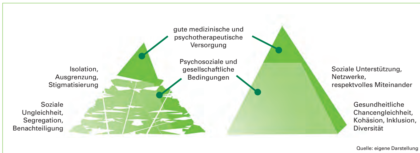
Abbildung 2: Der ressourcenorientierte und lebensweltbezogene Blick Sozialer Arbeit kann soziale Gesundheit auf individueller Ebene fördern.

mationelle und instrumentelle soziale Unterstützung in 8 verschiedenen Bereichen, beispielsweise Familie, Verwandtschaft, Kollegen, Freunde, unter anderem zu visualisieren. Bereits das Thematisieren und Sich-bewusst-Werden über das eigene Ausmaß sozialer Unterstützung kann Interventions-Charakter haben. Die Soziale Arbeit liefert mit ihrem ressourcenorientierten und lebensweltbezogenen Blick einen Ansatzpunkt zur Förderung von sozialer Gesundheit auf individueller Ebene.